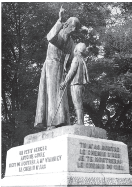
Pomnik upamiętniający przybycie nowo mianowanego Proboszcza, świętego Jana Marii Vianney, do Ars 9 lutego 1818 roku.