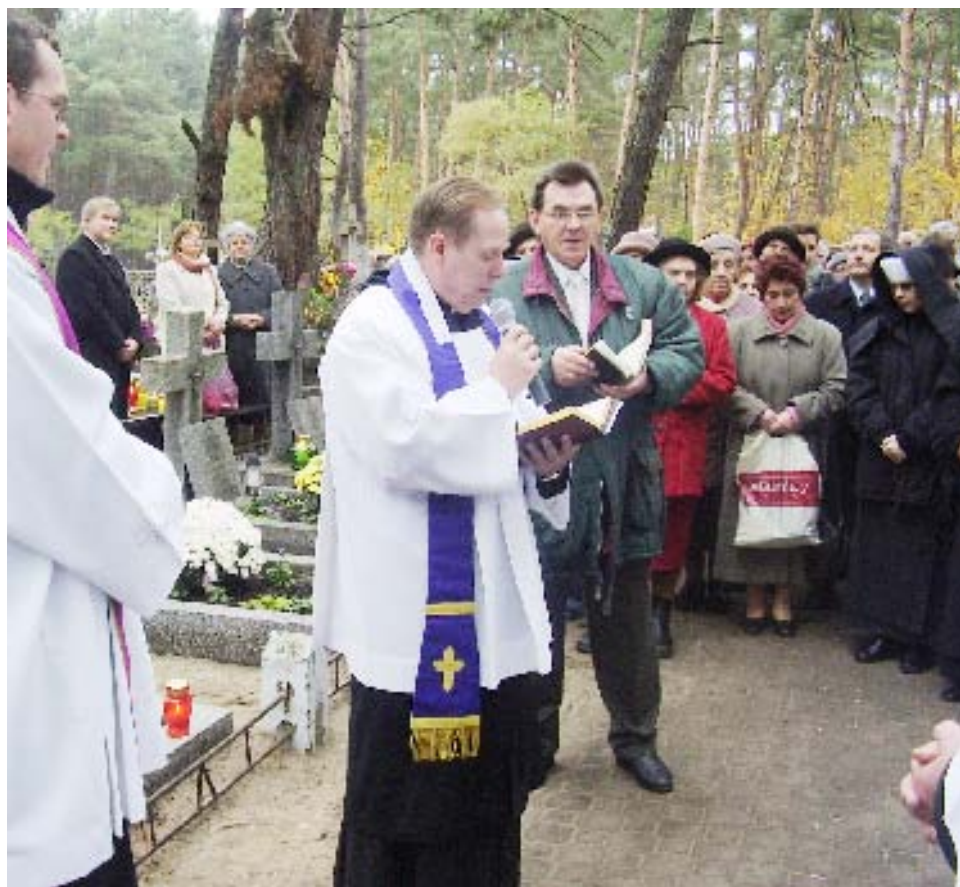
Uroczysta procesja na cmentarzu z modlitwą za dusze zmarłych.