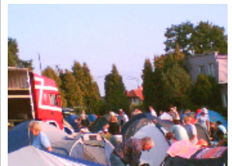
Namiotowe miasteczko pielgrzymów