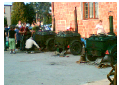
Kuchnie polowe z posiłkiem