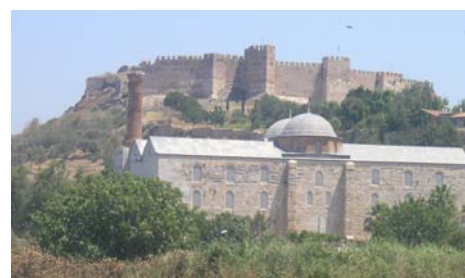
Bazylika i grób św. Jana Apostoła (za murami, w pobliżu Efezu)