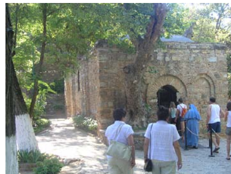
Domek Matki Bożej na wzgórzu koło Efezu (na zdjęciu: jedna z polskich zakonnice opiekujących się tym miejscem)

Kapadocja - kraina zamieszkiwana przez chrześcijan od pierwszego wieku po Chrystusie aż do wieku XII, kiedy to tereny te zajęli Turcy. Obszar Kapadocji pokryty jest skałami tufowymi, które łatwo poddawały się obróbce - drążeniu. W tych skałach chrześcijanie budowali kościoły, klasztory, mieszkania. Budowano całe kilkudziesięcioletnie podziemne, wielopoziomowe miasta, które łatwo było bronić przed najeżdżcą. Miasta te doskonale nadawały się do gromadzenia zapasów żywności, wody, dawały ochłodę przed słonecznym skwarem.