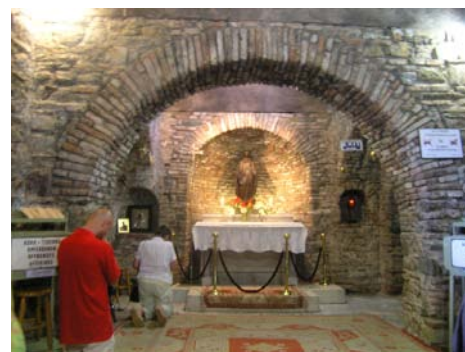
Kaplica w Domku Matki Bożej