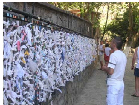
Ściana z powieszonymi modlitwami