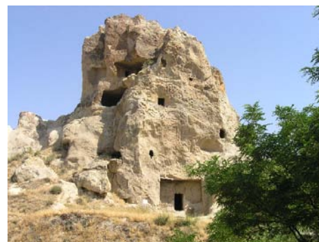
Kościółki i klasztory wydrążone w skale widok z zewnątrz - (Kapadocja)