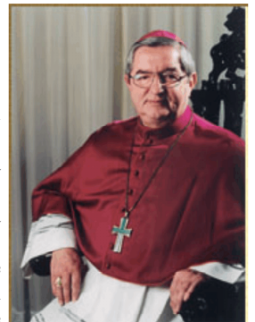
Cieszymy się, że dzisiaj Jesteś z nami